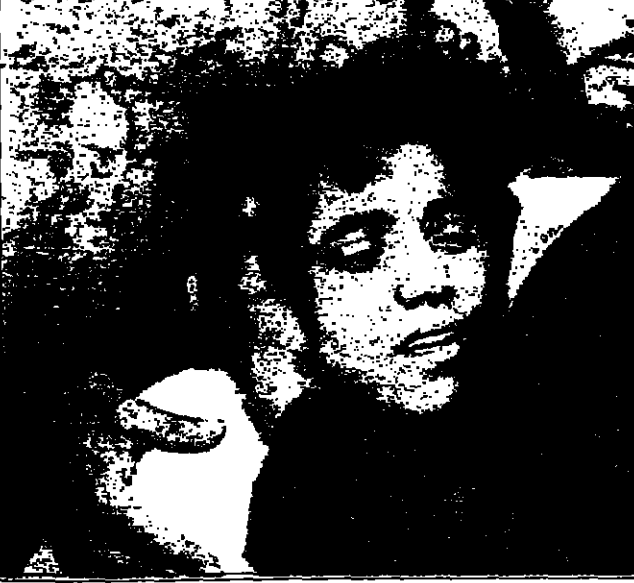
الابنة الوحيدة من عائلة تضم 10 افراد تحت من الجزيرة في الجزائر